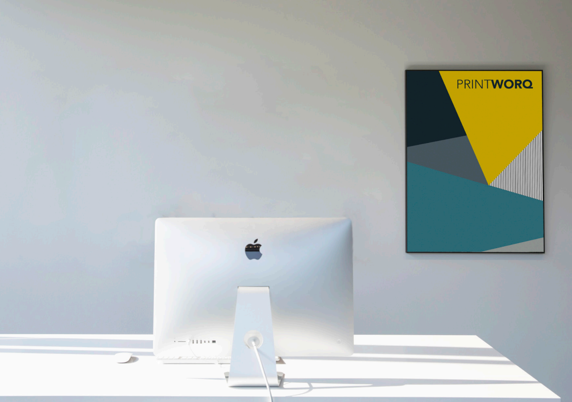
De bestelbare sample